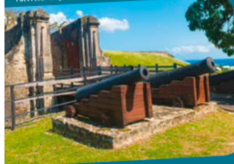
Fort Fleur d'Épée