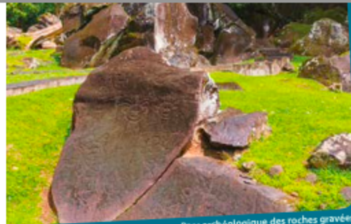
Parc archéologique des roches gravées

Direction des affaires culturelles de Guadeloupe et des îles du Nord 476 Allée des Pères Blancs - 97123 Baillif