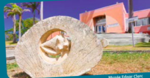
Musée Edgar Clerc